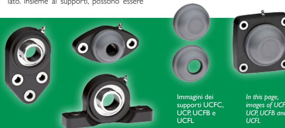
Immagini dei supporti UCFC, UCP, UCFB e UCFL

UCP, UCFL, UCFC, UCFB: tutte e quattro le tipologie sono disponibili a stock nell'ampio magazzino ISB.