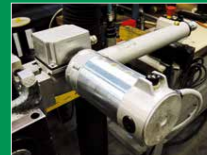
On the left, ALI 4 product and ALI 4 application. Below, Modula system Above, the production in Mecvel