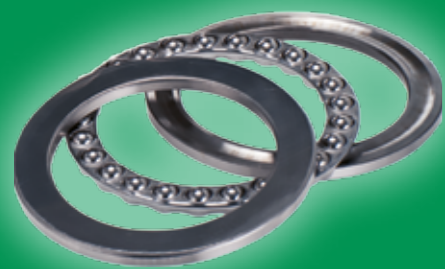
A sinistra un cuscinetto ISB assiale a sfere. A destra il modello ALI 3 IM sviluppato da Mecvel. Sotto la sede aziendale.