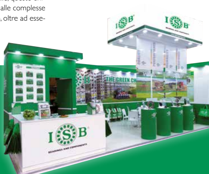
A sinistra i cuscinetti frangizolle ISB. A destra un'immagine dello stand ad Agritechnica

ISB ha scelto di effettuare questo ampliamento di gamma con diverse misure a stock , offrendo inoltre la possibilità di richiedere misure customizzate.