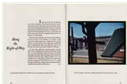
▲ Walker Evans, Rapid Transit, i.e. The Cambridge Review, Winter 1956.