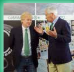
The new ISB SERVICE and, on the right, pictures of the opening ceremony